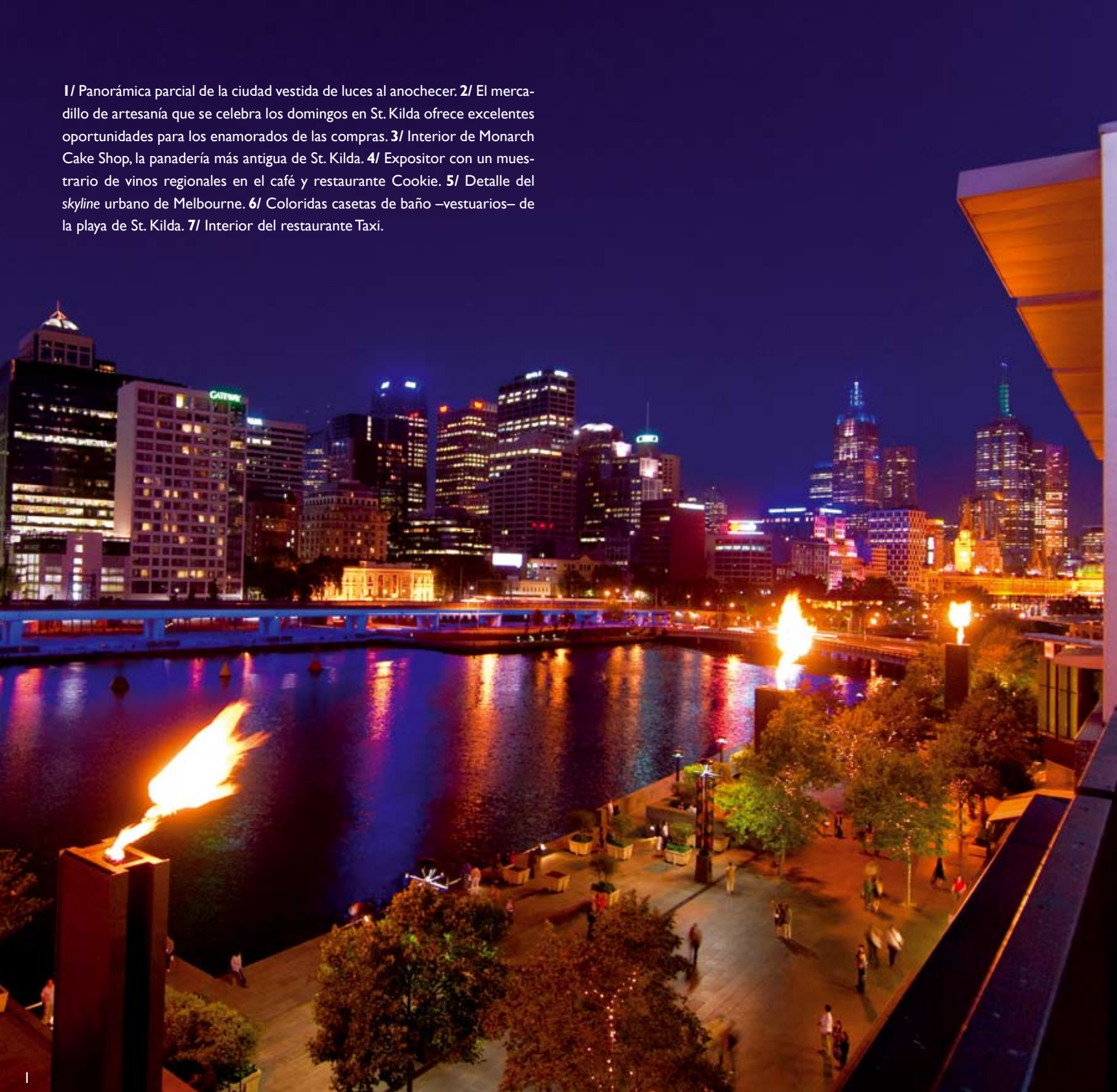
1/ Panorámica parcial de la ciudad vestida de luces al anochecer. 2/ El mercadillo de artesanía que se celebra los domingos en St. Kilda ofrece excelentes oportunidades para los enamorados de las compras. 3/ Interior de Monarch Cake Shop, la panadería más antigua de St. Kilda. 4/ Expositor con un muestrario de vinos regionales en el café y restaurante Cookie. 5/ Detalle del skyline urbano de Melbourne. 6/ Coloridas casetas de baño –vestuarios– de la playa de St. Kilda. 7/ Interior del restaurante Taxi.